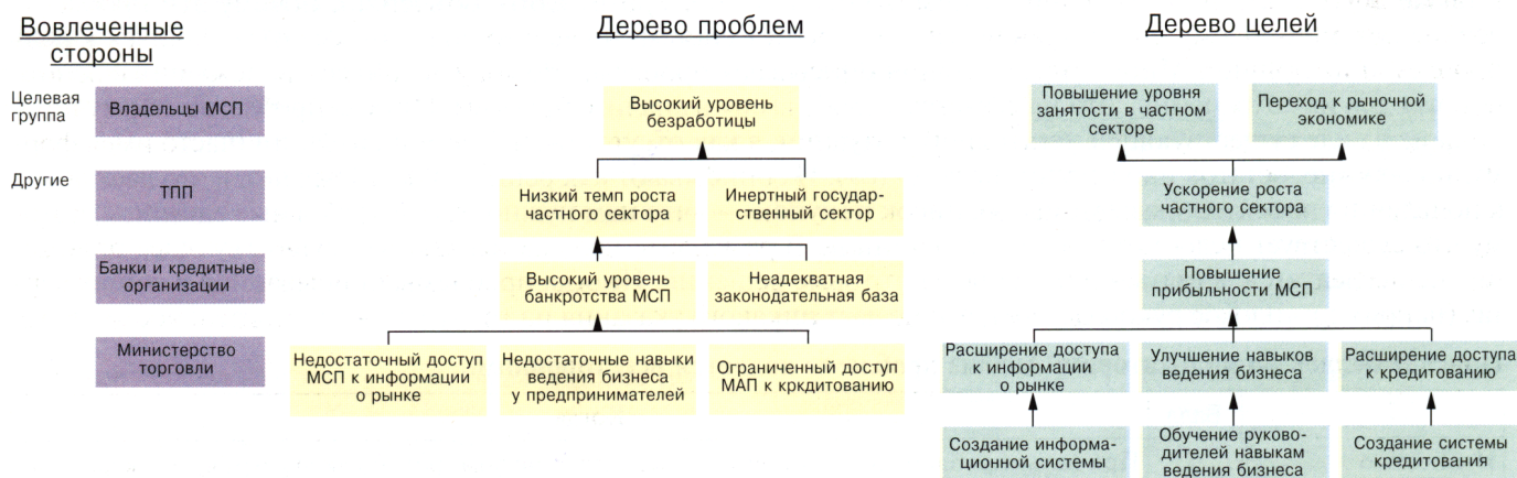
Иллюстрация ожидаемых результатов:

Используя карточки с формулировками целей, подготовленные на предыдущем этапе, постройте дерево целей. Для получения дальнейших указаний по данному шагу обратитесь к Приложению 1.